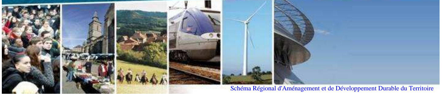
Schéma Régional d'Aménagement et de Développement Durable du Territoire